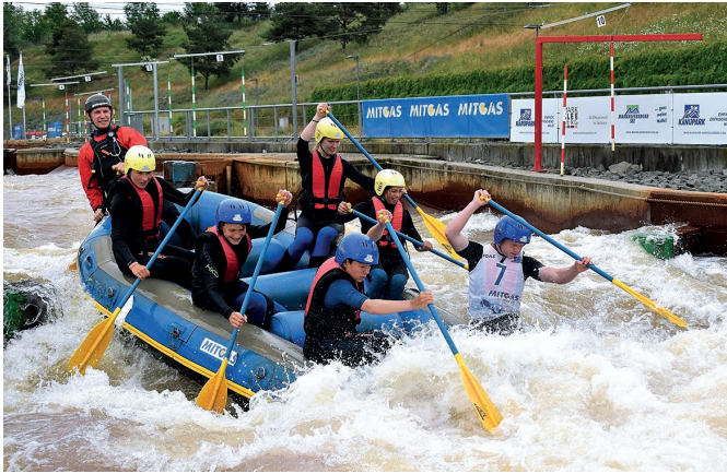
Das Team „Spogyra“ paddelte allen davon und gewann die 14. Auflage des MITGAS Schüler-Raftings.