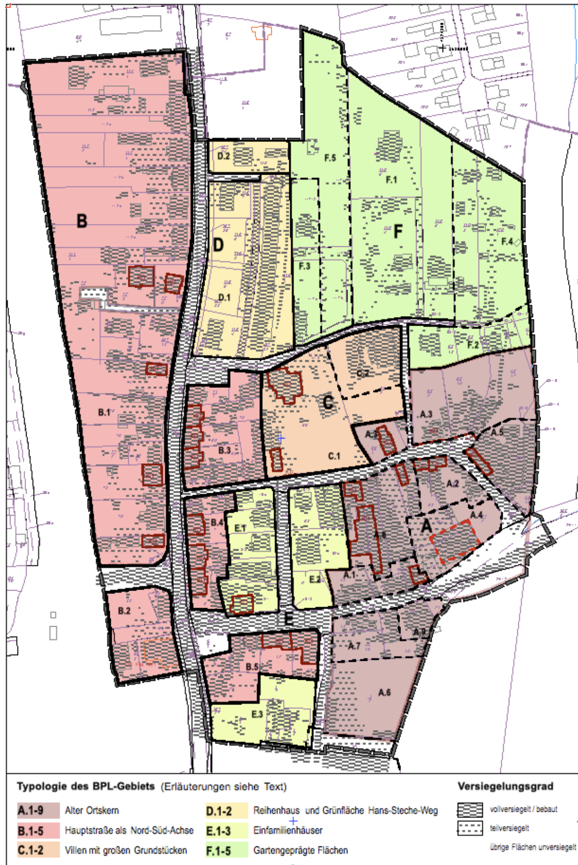
Abb. 2 Typologie und Versiegelungsgrade. Dunkelrot umrandet die Kulturdenkmale, gestrichelt rot die ehemalige Centralhalle.