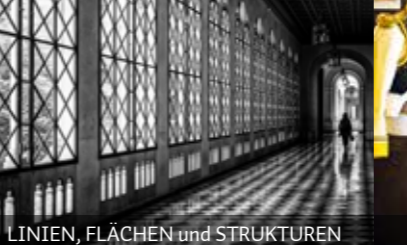
LINIEN, FLÄCHEN und STRUKTUREN