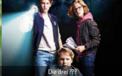
Die drei ???