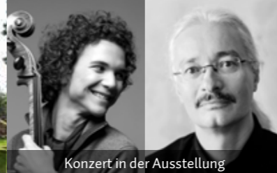
Konzert in der Ausstellung