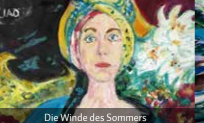
Die Winde des Sommers