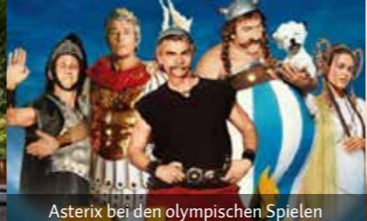
Asterix bei den olympischen Spielen