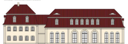
TORHAUS SÜD + ORANGERIE - ANSICHT SÜDSEITE